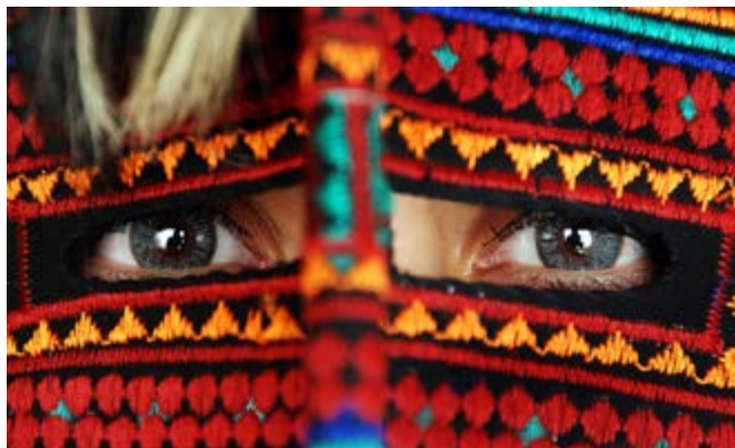
© Fekri, Majid, A Look, Iran

Präsentiert von der fotografischen Vereinigung IRANIPC, Teheran