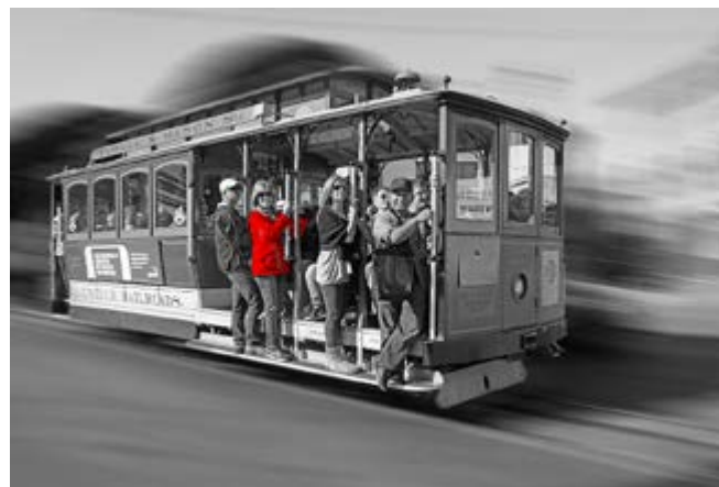
San Francisco Cable Car Red

Der weltweit ausgeschriebene Fotowettbewerb German International DVF- Photocup fand 2012 zum zweiten Mal statt. Fast 1500 Teilnehmer aus 60 Nationen nahmen daran teil. Daraus entwickelte sich die Ausstellung einiger iranischer Teilnehmer, die sich und ihr Land in Deutschland präsentieren wollen. Die Ausstellung wird in verschiedenen Städten in Deutschland gezeigt. Als zweite Station präsentiert der fotoclub filderstadt e.v. nun diese Ausstellung