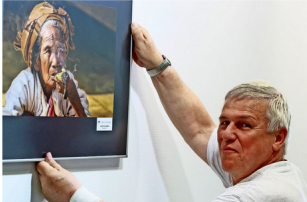
Dieter Ehmann hat die Organisation der Bilderschau übernommen.

In der Städtischen Galerie Filderstadt sind ausdrucksstarke Bilder von sieben Fotoclubs aus Deutschland und Tschechien zu sehen. Auch Fotografen des heimischen Clubs sind vertreten.