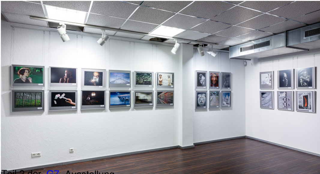
Teil 2 der G7 Ausstellung

Montag, den 11. Januar 2016 um 13:11 Uhr