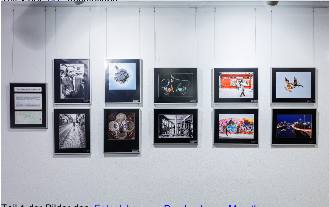
Teil 1 der Bilder des Fotoclubs aus Dombasle-sur-Meurthe