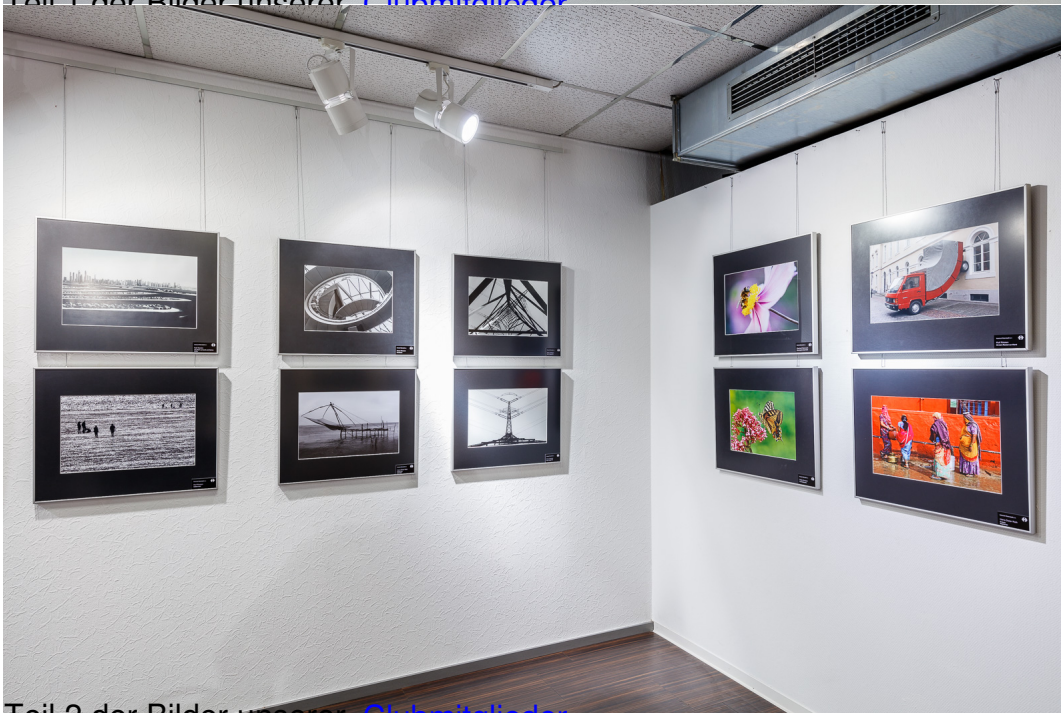
Teil 2 der Bilder unserer Clubmitglieder