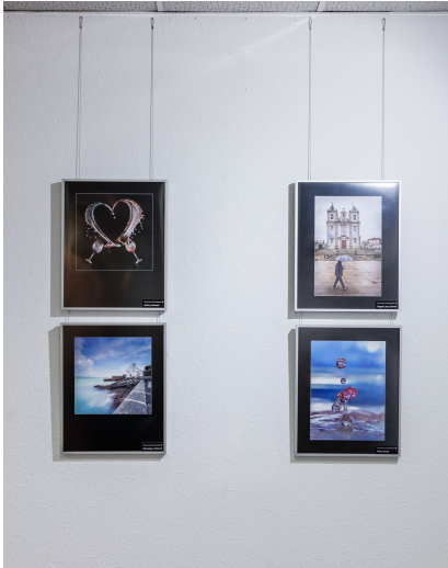
Teil 2 der Bilder des Fotoclubs aus Dombasle sur Mourthe

Montag, den 11. Januar 2016 um 13:11 Uhr