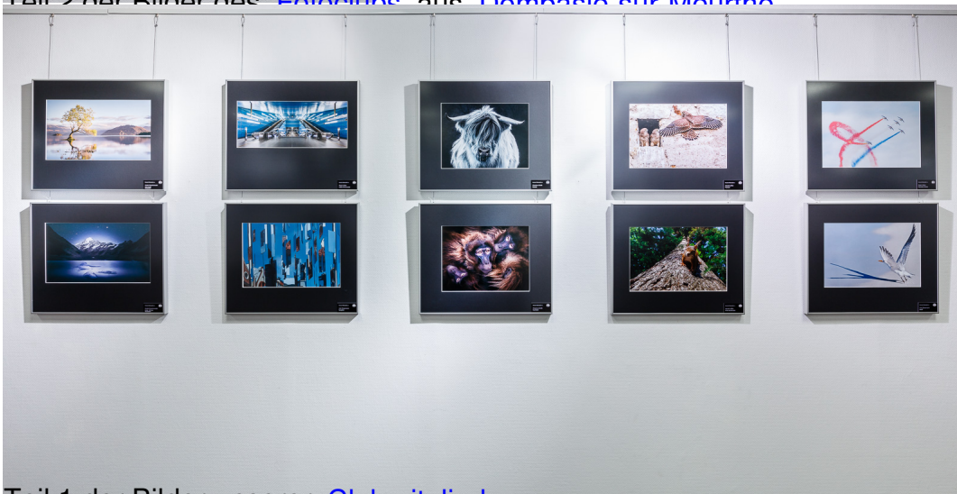
Teil 1 der Bilder unserer Clubmitglieder