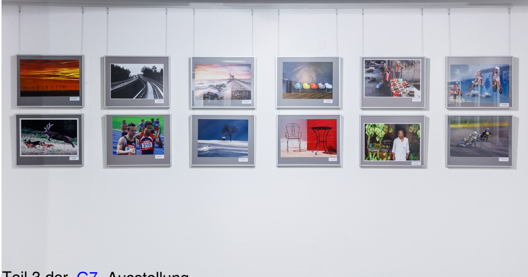
Teil 3 der G7 Ausstellung